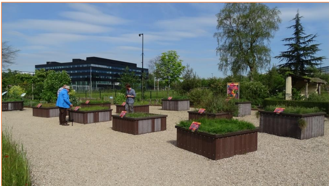
Figuur 3: Kweekbakken (biomen) worden gebruikt in de Botanische tuin van Utrecht.

Voor het opkweken van zaden in zaadhofjes zijn geschikte plekken nodig met de juiste omstandigheden. Een voorbeeld is het hebben van kalkrijke grond voor bepaalde soorten. Voor lang houdbare zaden heeft het niet zo'n haast om zaadhofjes te realiseren. Juist voor de zeer kort kiemkrachtige zaden moet juist wel een plan komen om het onmiddellijk uit te zaaien in hofjes. De kiemkrachtbepaling zal helpen om te kunnen beoordelen welke zaden lang houdbaar zijn en welke planten maar korte tijd kiemkrachtig blijven. Er zijn verschillende soorten zaadhofjes mogelijk. Planten kunnen worden opgekweekt in bakken waarin specifieke groeicondities heersen (zie figuur 3). Particulieren kunnen ook grond in hun (moes)tuin beschikbaar stellen (zie figuur 4).