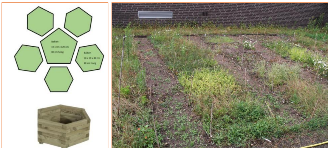
Figuur 4: Links de bakken voor in dit geval stroomdalgrasland soorten op te kweken en vermeerderen. Rechts zaadhofjes voor het kleinschalig opkweken en vermeerderen van diverse soorten bedreigde akkerplanten door Natuurbalans-Limes Divergens.